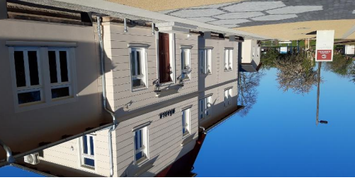
Weg zum Kaolin