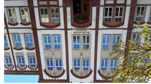
Goetheschule Mügeln