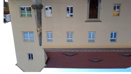
Heimatmuseum Mügeln