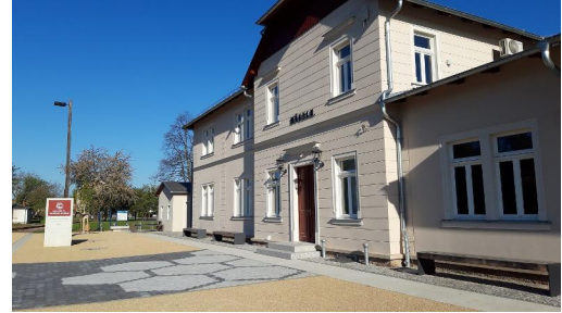
Geoportale Bahnhof Mügeln