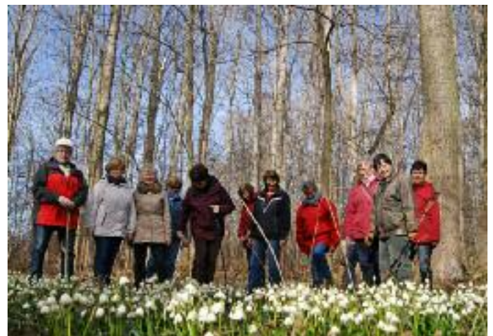
Wandergruppe unterwegs (Sven Bartsch)

Kritisch muss bemerkt werden, dass Menschen immer noch in unverantwortlicher Weise Müll an vielen Orten in die Landschaft kippen. Zumal es sich zu großen Teil um Verpackungsmaterial handelte, das kostenlos über Container oder Gelben Sack entsorgt werden kann. Es müssen auch keine „armen“ Zeitgenossen gewesen sein, denn 3-l-Behälter für Algenentferner hat nicht jeder im Wirtschaftsschrank!