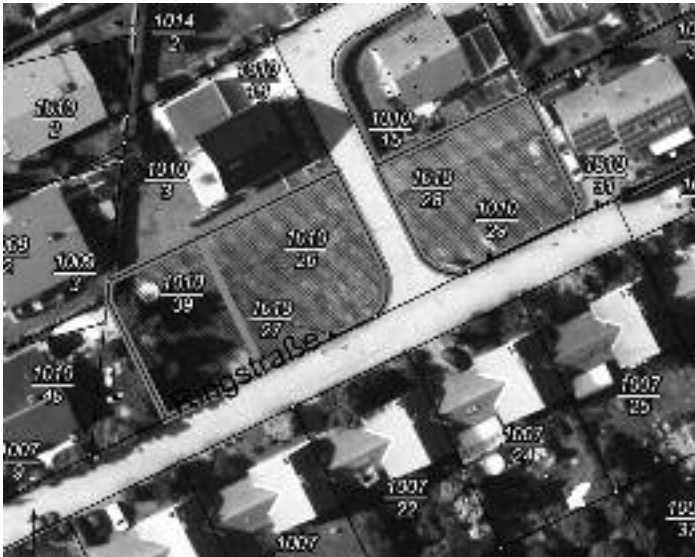
Wohnungsbaugelbiet „RingstraÙe“ in Muegeln