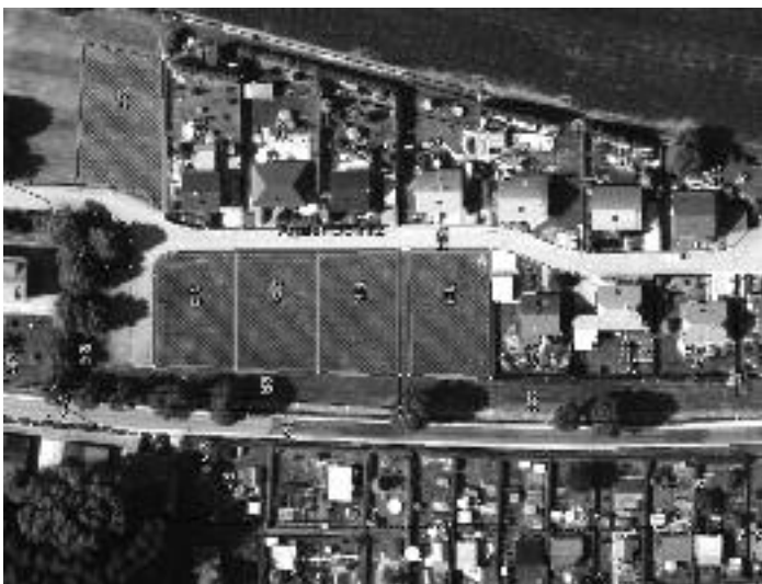
Wohnungsbaugelbiet „An der Doellnitz“ in AblaÙ

Flurstuecke gelegen in der Gemarkung Querbitzsch 95/16 = 769 m 2 , 95/33 = 604 m 2 , 95/32 = 637 m 2 , 95/31 = 649 m 2 , 95/30 = 669 m 2