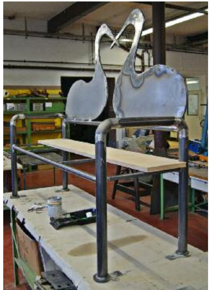
Die Storchenbank im Sächsischen Umschulung- und Fortbildungswerk Dresden e.V. in der Endfertigung.

einzahlen. Spendenquittungen werden auf Verlangen ausgestellt. Als Anreiz bietet der Verein an: Wer mehr als 200,00 € spendet, kann bei der Beringung den Namen für einen in Mügeln geschlüpften Storch bestimmen! Nicht nur der allgemeinen Neugier, sondern auch zum Schutz der seltenen Vögel dient dieses Vorhaben. In Erfahrung der letzten Jahre bringt es die Möglichkeit, dass unsere Naturschützer bei Gefahr für die Jungtiere schneller eingreifen können.