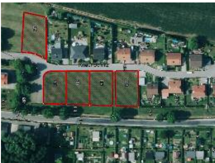
Wohnungsbaugebiet „An der Döllnitz“ in Ablaß

Flurstücke gelegen in der Gemarkung Querbitzsch 95/16 = 769 m 2 , 95/33 = 604 m 2 , 95/32 = 637 m 2 , 95/31 = 649 m 2 , 95/30 = 669 m 2