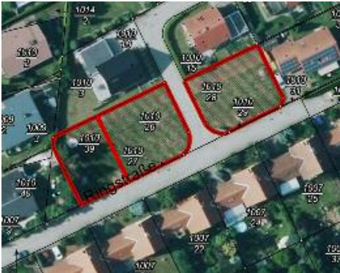
Wohnungsbaugebiet „Ringstraße“ in Mügeln

Ausbau Mügeln GmbH, Dr.-Friedrichs-Straße 67, 04769 Mügeln Telefon: (03 43 62) 4 04-0, Fax: (03 43 62) 4 04-39