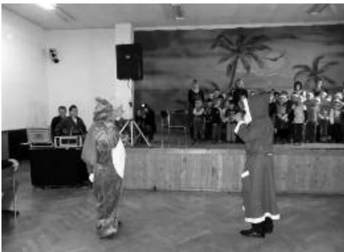
Der Weihnachtsmann, aber auch der Osterhase war zu Gast!