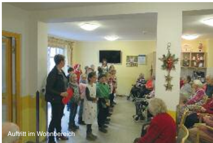
Auftritt im Wohnbereich