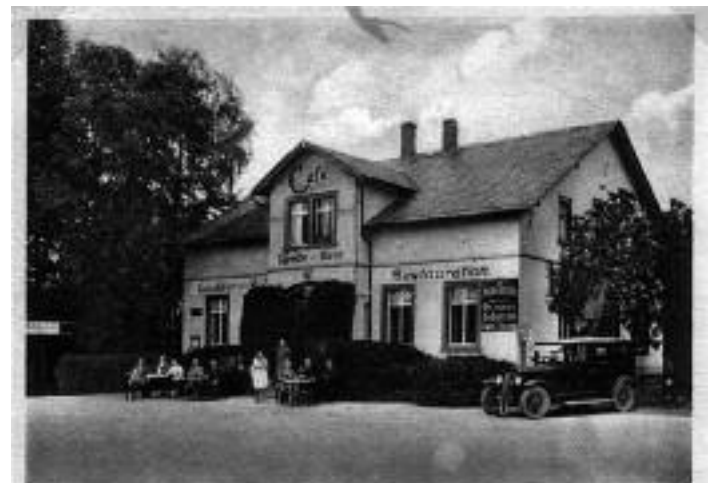
Bahnhofrestaurant u. Café Conditorei, Bäckerei, schattiger Garten Jah. Theodor Dietze Telephon 377

Es wird darüber hinaus um eine Spende für den Aufbau eines historischen Personenwagens gebeten!