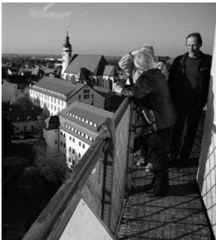
Aussicht vom Hausmannsturm