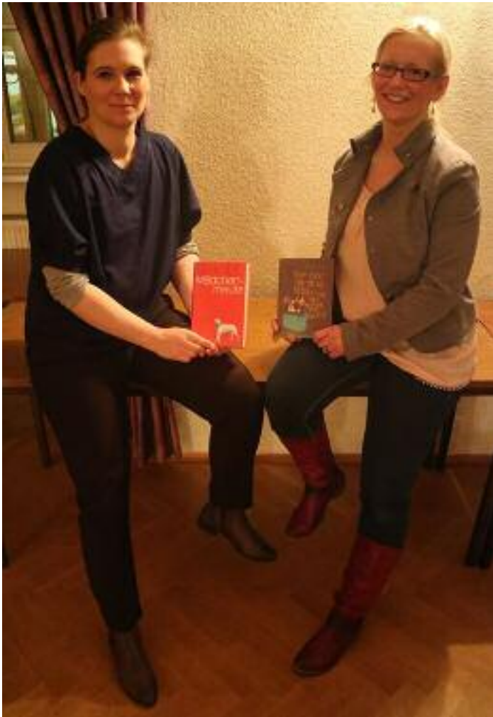
Die nächste Buchvorstellung gibt es am 18. 1. 2018, 19.00 Uhr im Ratssaal, Eintritt frei, Thema: 500 Jahre Lommatzcher Pflege