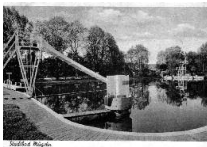
Das Stadtbad zu Ende der 1930er Jahre

Mit der Machtergreifung der Nationalsozialisten wehte ein anderer Wind. Der Arbeitersportverein, der die Eröffnungsfeier so grandios mitgestaltet hatte, wurde als „Staatsfeindlich“ eingestuft und sein Vermögen beschlagnahmt. In Mügeln bedeutete das, das Heim des Sportbundes, das ehemalige Gebäude des Döllnitzbades, wurde von der SA übernommen und das Inventar „großzügig“ verteilt. Orga-