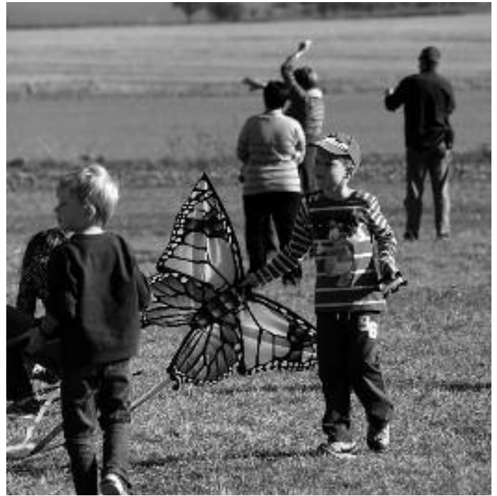
Bei herrlichem Sonnenschein fand dann am 20. Oktober unser diesjähriges Drachenfest statt. Zwar fehlte der Wind zum ordentlichen Drachensteigen, dennoch schafften es viele unermüdliche Kinder und Eltern, ihren Drachen zumindest kurz mit Laufen in der Luft zu halten. Basteleien und Kaffee und Kuchen sowie eine Baustellenbesichtigung rundeten den Nachmittag ab.

Nun sind schon wieder Herbstferien und unser Hort hat ein buntes Programm mit Sport, Basteln, Kochen und Spielen vorbereitet. Der Schulbau startet noch einmal durch in die letzten 6 Wochen.