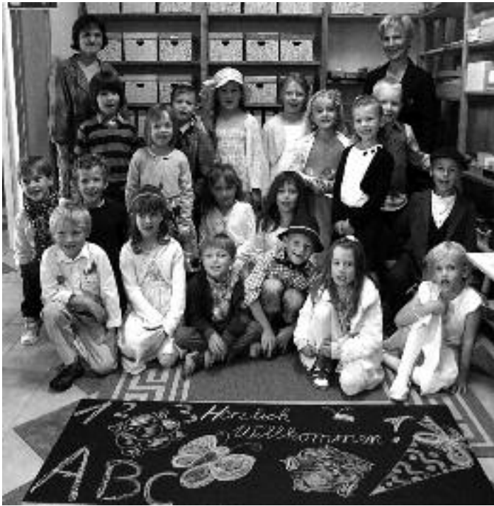
Ende September fanden wir, es sei Zeit unseren Bauarbeitern für die bisher geleistete Arbeit zu danken und luden zu Bratwurst und Bier ein.