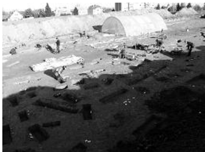
Foto: Mügeln, Seniorenheim. Blick über die Grabungsfläche mit zahlreichen Pfostenbefunden

Alle Interessierten sind zu diesem Vortrag herzlich eingeladen.