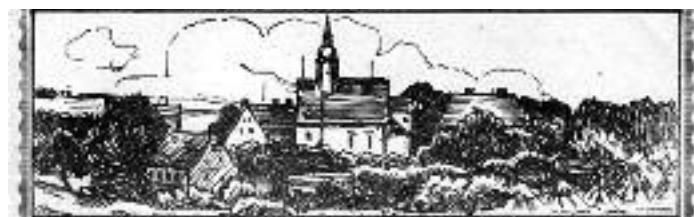
Abdruck: Kirche Ablaß