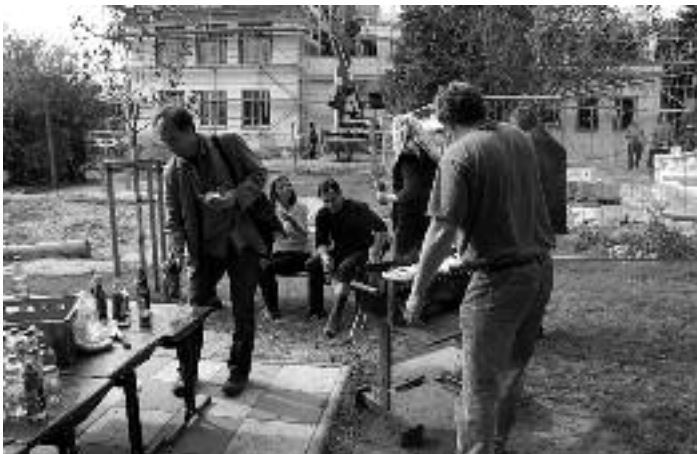
Der nächste Höhepunkt folgte schon Mitte Oktober: Das „Konzert der Ehemaligen“. Mehr als 30 ehemalige Apfelbaum-Schüler, die nun in den Jahrgangstufen 5 bis 11 sind, musizierten zugunsten ihrer ehemaligen Schule. Nicht nur das hohe musikalische Niveau beeindruckte das Publikum im vollbesetzten Rathaussaal von Mügeln, sondern auch die Verbundenheit der Jugendlichen mit ihrer ehemaligen Grundschule.