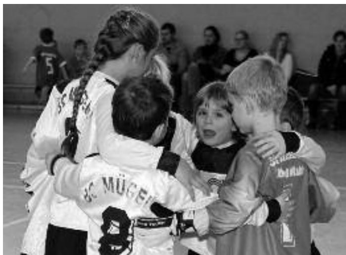
Mannschaftskreis vor Spielbeginn