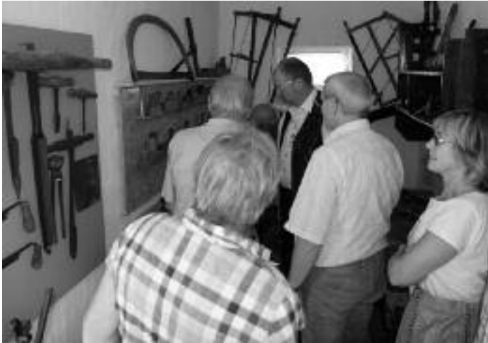
Die neue Schauwerkstatt zur Eröffnung

bargrundstückes Schulplatz 2 fanden zahlreiche historische Werkzeuge aus der Holzverarbeitung einen würdigen Platz. Bei Bedarf können diese auch in ihrer Funktion vorgeführt werden. Neben der im vergangenen Jahr eingeweihten Schlosser- und Schmiedewerkstatt bildet diese Ausstellung eine sehenswerte Bereicherung zur traditionsreichen Handwerksgeschichte unserer Stadt. Vielen Dank an die vielen Spender, die altes Werkzeug dafür abgegeben haben. Am gleichen Tag konnte noch eine neue Sonderausstellung im Museum übergeben werden. Diese zeigt originale Zeichnungen aus der Bauzeit der Goetheschule um 1885 sowie von späteren Umbauten. Der Anlass zu dieser Schau war, dass der in Mügeln ge-