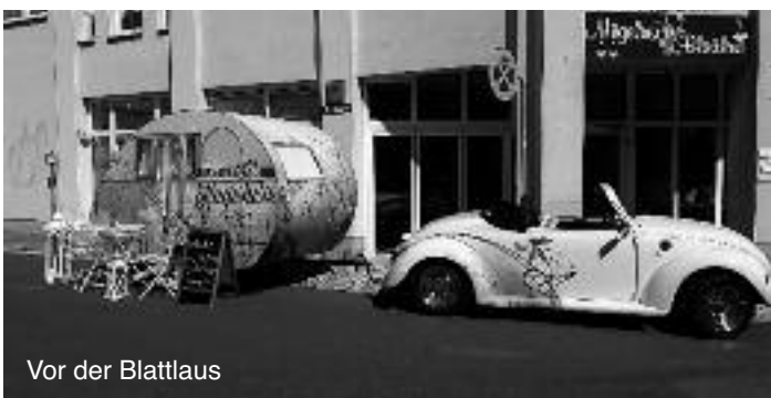
Vor der Blattlaus

Wir danken recht herzlich allen Händlern, Vereinen, dem Bauhof, allen Helfern und unseren Sponsoren für die Hilfe beim Stadtfest: