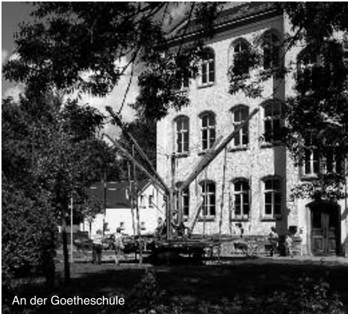
An der Goetheschule