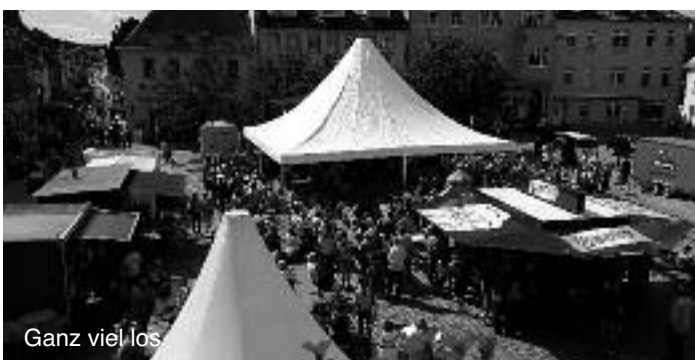
Ganz viel los