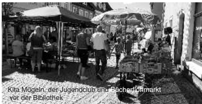
Kita Mügeln, der Jugendclub und Bücherflohmarkt vor der Bibliothek