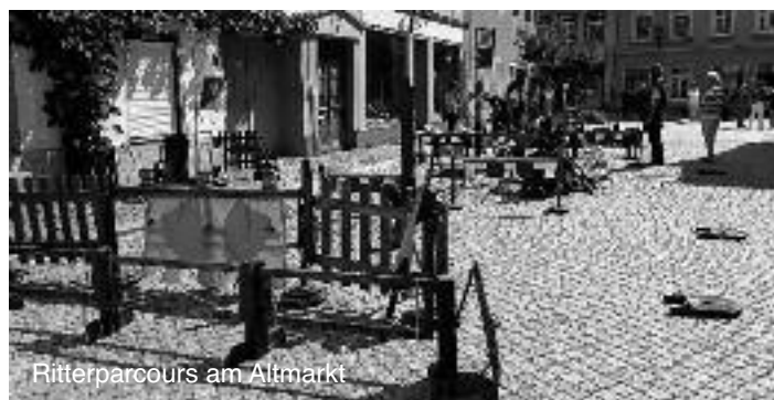
Ritterparcours am Altmarkt