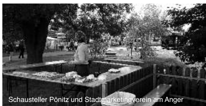
Schausteller Pönitz und Stadtmarketingverein am Anger