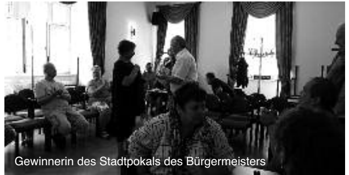
Gewinnerin des Stadtpokals des Bürgermeisters