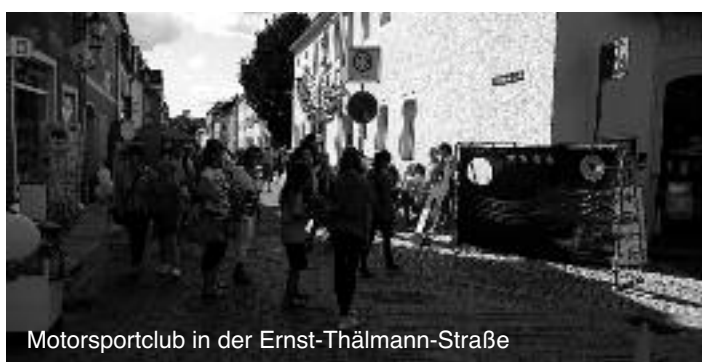
Motorsportclub in der Ernst-Thälmann-Straße