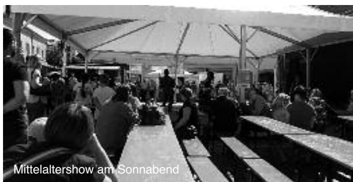
Mittelaltershow am Sonnabend