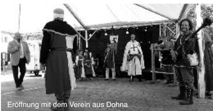
Eröffnung mit dem Verein aus Dohna