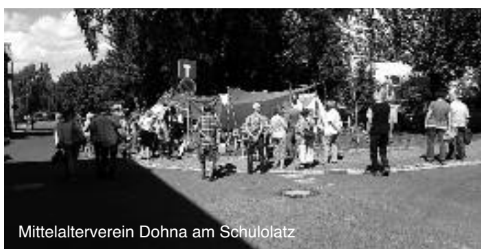
Mittelalterverein Dohna am Schulolatz