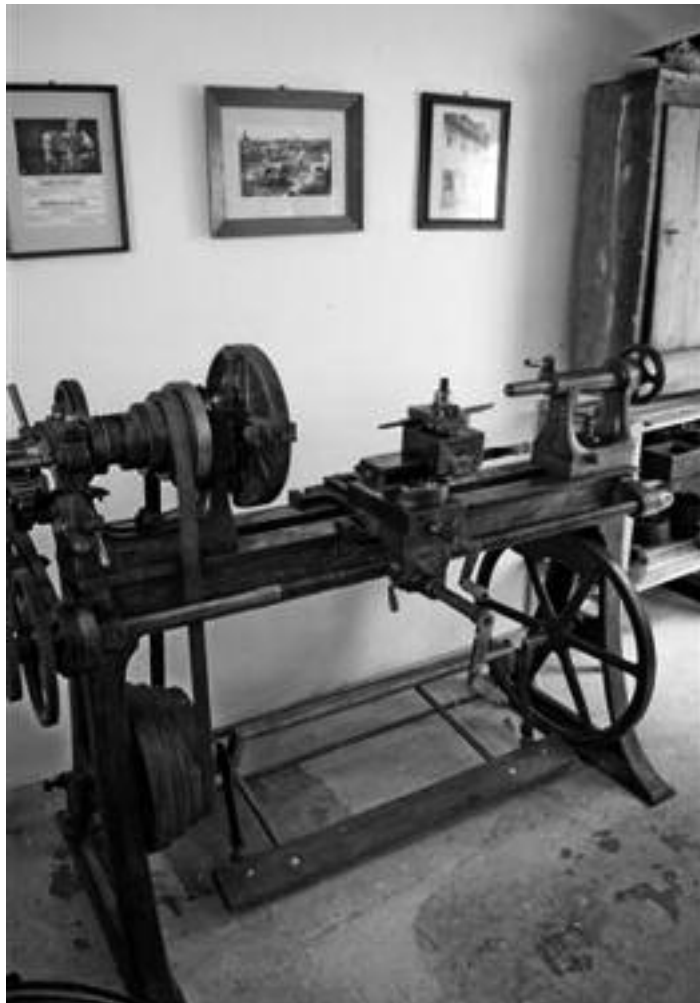
Schlosser- und Schmiedewerkstatt

zu besichtigen. Der gelernte Berufsschullehrer des Metallhandwerks outete sich als Fan von historischen Bearbeitungsmaschinen. Er besitzt einige, die er selbst aufgearbeitet hat. In einem weiteren nicht mehr genutzten Schuppenraum soll demnächst eine Stellmacherei eingerichtet werden. Zahlreiche Werkzeuge des Tischler- und Zimmererhandwerks sollen hier auch in Funktion der Öffentlichkeit präsentiert werden.