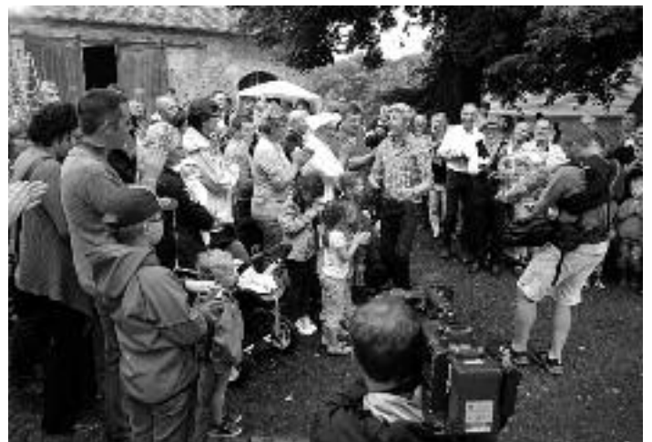
Sornziger Klosterfest – Sornziglied