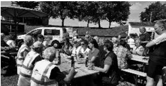
Rast in Gallschütz