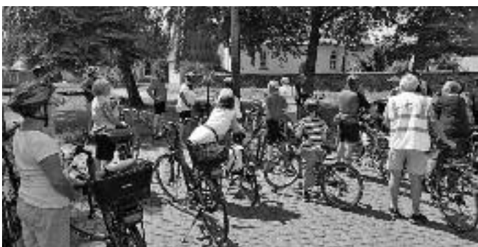
Halt in Börtewitz