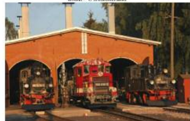
Text: SV Mügeln mit freundlicher Unterstützung der Döllnitzbahn GmbH und der Geopark-Pressstelle

Mehr Informationen zur Döllnitzbahn und den Sonderfahrttagen des „Wilden Robert“: