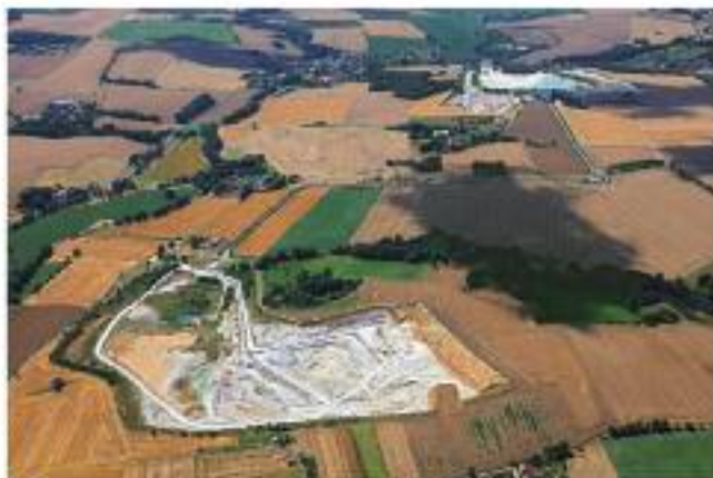
Luftaufnahme der Tagebaue „Schleben/Crellenhain“ (im Vordergrund) und „Gröppendorf“

direkt angefahren. Das hier geförderte und aufbereitete Kaolin wurde zum wichtigsten Transportgut für die Mügelner Schmalspurbahn. Seit 2016 fährt der „Wilde Robert“, nach langer Streckenstilllegung, auch wieder bis nach Kemmlitz.