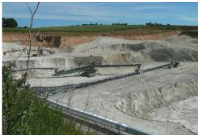
Gewinnungstechnik im Tagebau „Schleben/Crellenhain“

Schlammkaolin gilt als der beste keramische Kaolin für feinkeramische Anwendungen Deutschlands und ist weit über Europa hinaus geschätzt. Seit Beginn des Kaolinabbaus im Jahr 1883 bis heute wurden hier ca. 300 ha Land für die Rohstoffgewinnung in Anspruch genommen. Gegenwärtig umfasst das Betriebsgelände der Kemmlitzer Kaolinwerke eine Gesamtfläche von ca. 120 ha – Spülhalden und Absetzbecken eingeschlossen. 160 ha der immer nur zeitweise genutzten Fläche wurden bereits wieder nutzbar gemacht vorrangig für land- und forstwirtschaftliche Nutzungen bzw. bewaldeten sich selbst durch natürliche Sukzession. In einigen der ehemaligen Tagebaue wurden unterschiedlich große Gewässer angelegt, die auch von örtlichen Angelvereinen genutzt werden. In anderen ehemaligen Gruben haben sich Pionierwälder entwickelt oder Restseen bzw. zeitweise kleine Teiche gebildet. Die Flachwasserbereiche dieser nährstoffarmen Teiche stellen auch hier wertvolle Lebensräume für andernorts selten gewordene Tier- und Pflanzenarten dar.