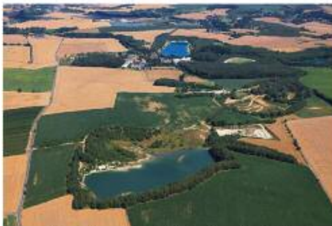
Luftaufnahme des Westteils des Kemmlitzer Kaolinreviers. Der Kaolintagebau „Glückauf“ im Vordergrund.

Schlammkaolin gilt als der beste keramische Kaolin für feinkeramische Anwendungen Deutschlands und ist weit über Europa hinaus geschätzt. Seit Beginn des Kaolinabbaus im Jahr 1883 bis heute wurden hier ca. 300 ha Land für die Rohstoffgewinnung in Anspruch genommen. Gegenwärtig umfasst das Betriebsgelände der Kemmlitzer Kaolinwerke eine Gesamtfläche von ca. 120 ha – Spülhalden und Absetzbecken eingeschlossen. 160 ha der immer nur zeitweise genutzten Fläche wurden bereits wieder nutzbar gemacht vorrangig für land- und forstwirtschaftliche Nutzungen bzw. bewaldeten sich selbst durch natürliche Sukzession. In einigen der ehemaligen Tagebaue wurden unterschiedlich große Gewässer angelegt, die auch von örtlichen Angelvereinen genutzt werden. In anderen ehemaligen Gruben haben sich Pionierwälder entwickelt oder Restseen bzw. zeitweise kleine Teiche gebildet. Die Flachwasserbereiche dieser nährstoffarmen Teiche stellen auch hier wertvolle Lebensräume für andernorts selten gewordene Tier- und Pflanzenarten dar.