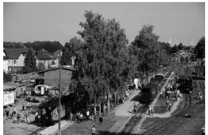
Bahnhof Mügeln, Quelle: Döllnitzbahn GmbH

Im Rahmen des Bahnhofsfestes soll am Stand des Geoportals Bahnhof Mügeln eine kleine Palette mit Produkten gezeigt werden, die zu DDR-Zeiten aus Kaolin hergestellt wurden. Vielleicht hat der eine oder andere Mügелner noch Exponate, wie beispielsweise DDR-