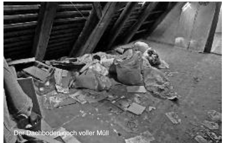
Der Dachboden noch voller Müll