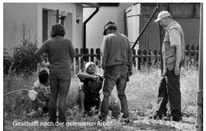
Geschafft nach der geleisteten Arbeit