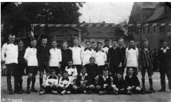
Der Fußballplatz des BCM auf der ehemaligen Schützenwiese

Mügelner Vergangenheit gab es viele Möglichkeiten hier in der Stadt Sport zu treiben! Unter Anderem gab es drei Fußballplätze, fünf Kegelbahnen sowie einen öffentlichen und einen privaten Tennisplatz.