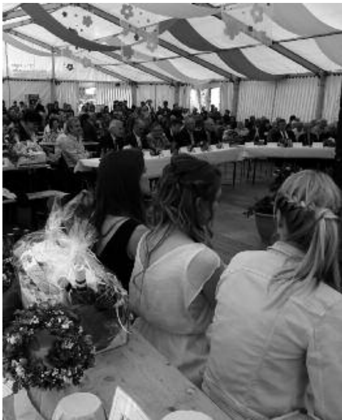
Jury im Festzelt