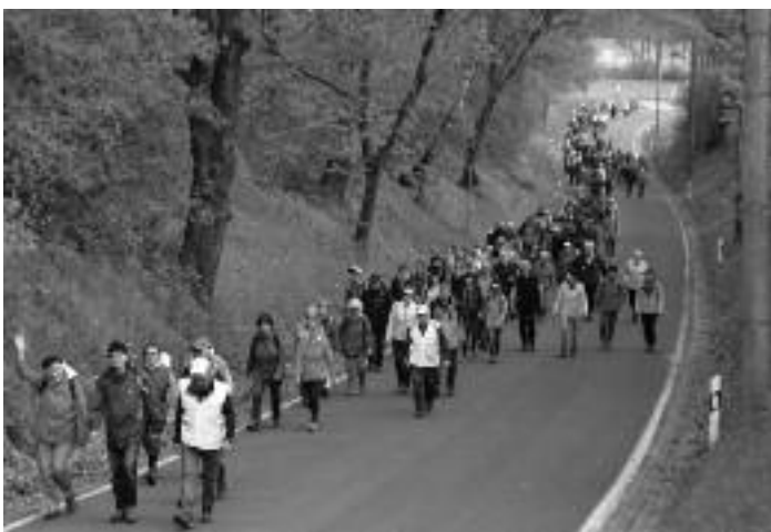
Was für eine imposante Menschenschlange, die da in der Poppitzer Hohle unterwegs ist. Deren Anblick lies die Herzen der Organisatoren vor Freude tanzen.