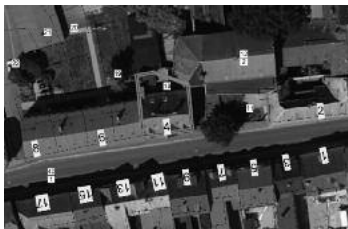
Lageplan Ernst-Thälmann-Straße 4