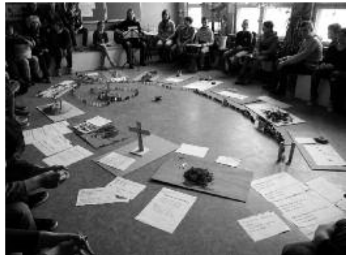
Präsentation „Die 14 Stationen des Kreuzweges“ in der Aula

Wir laden interessierte Kinder gern zu einer „Schnupperwoche“ ein, um die Naundorfer Oberschule, die Lehrkräfte und die Schülerschaft kennenzulernen. Als Stärken der staatlich anerkannten Ober-