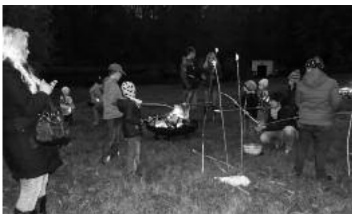
Stockbrot am Teich