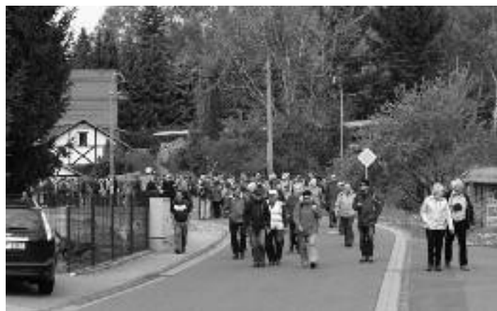
Die Wanderer in Börtewitz

Bei perfektem Wetter konnten die Teilnehmer unserer 11. Bahndammwanderung zwischen drei Routen von einmal 10 km über den Naturerlebnispfad in Kemmlitz, 13 km über Börtewitz und 17 km über Kropchwitz wählen. Alle Strecken hatten ihren Reiz, so dass die Teilnehmer von unserer Region begeistert waren.