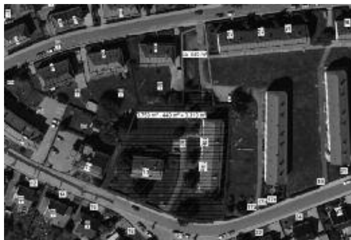
Lageplan Rosa-Luxemburg-Straße 13, 15a/b

Die Stadt Mügeln verkauft als Eigentümerin nachfolgende Grundstücke in der Gemarkung Mügeln.