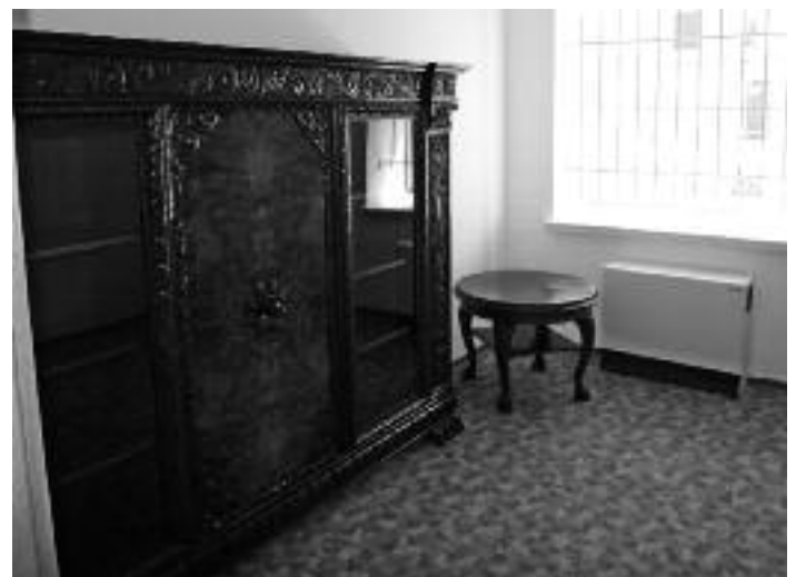
Der noch fast leere Raum für das Schmorl – Archiv