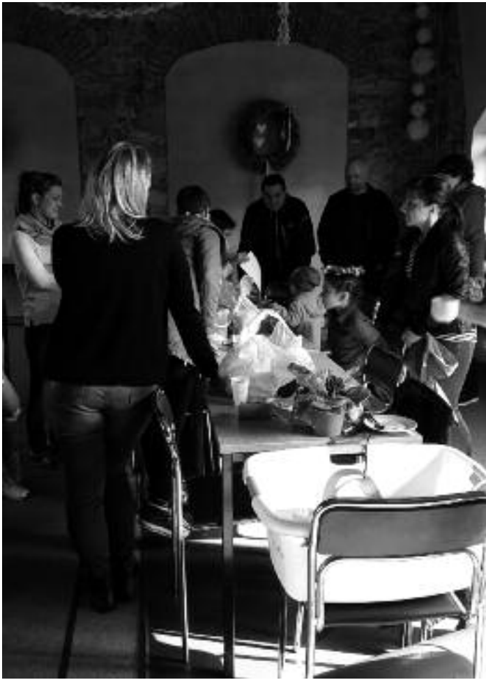
Bastelstraße Kita Sornitz