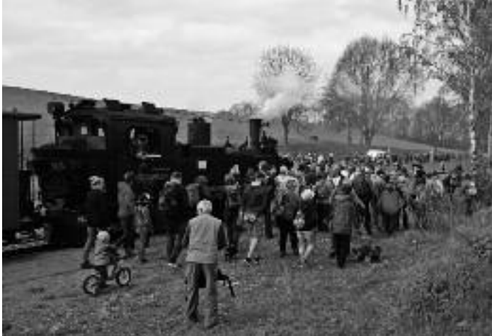
Start am Bahnhof Nebitzschen

Allen, die zum Erfolg dieses Tages beigetragen haben, besonders bei den Mitarbeitern der Döllnitzbahn GmbH sowie bei dem Team vom Kloster Sornzig möchten wir auf diesem Wege noch einmal unseren Dank ausdrücken.