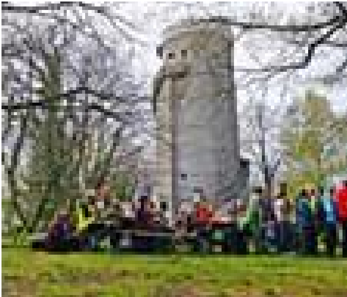
Die an dem Tage am höchsten gelegene Raststelle des Kreises Nordsachsens auf dem Collm