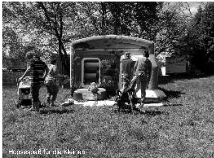
Hopsespaß für die Kleinen