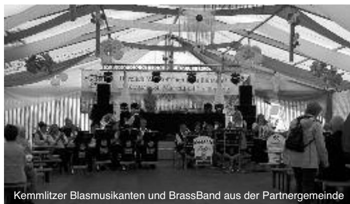
Kemmlitzer Blasmusikanten und BrassBand aus der Partnergemeinde