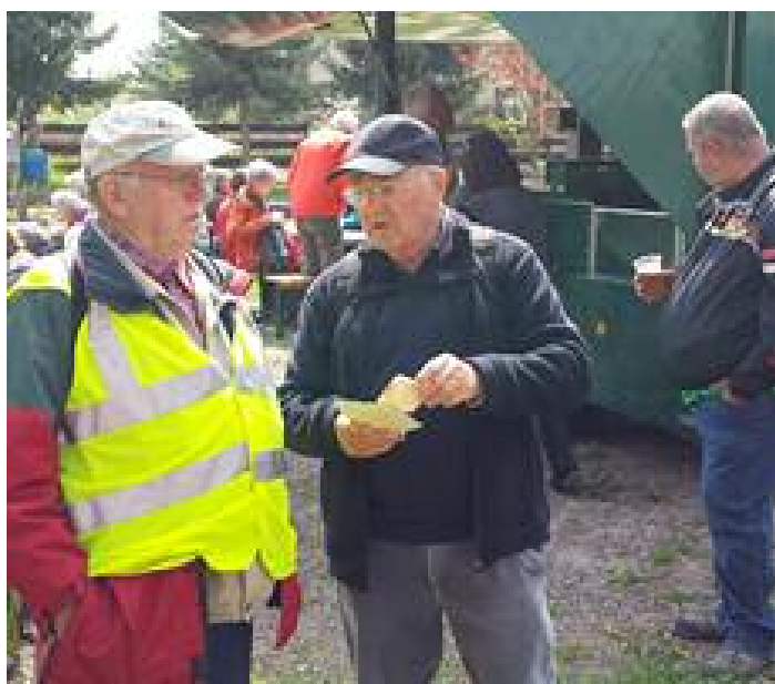
Rast am Lampersdorfer Teich

Gegenwärtig laufen die Planungen im Verein für die 11. Wanderung im nächsten Jahr an. Diesmal unter dem Motto des zehnjährigen Bestehens. Unter den diesjährigen Teilnehmern gab es für uns viele Hinweise, welche Strecken sie gern noch einmal bewandern würden.