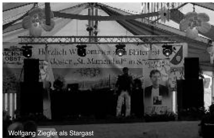
Wolfgang Ziegler als Stargast