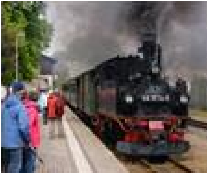
Rückfahrt nach Mügeln