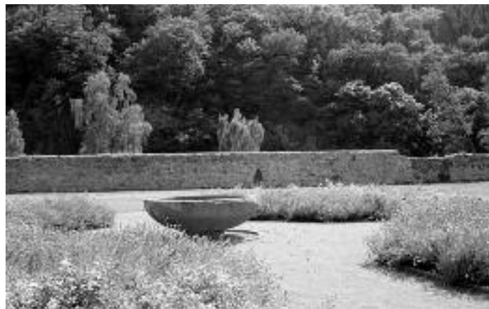
Kreuzgarten beim Kloster Buch

Informationen zum Kloster und Anreise: www.klostersorntzig.de Hinweis: Abweichungen von den Wanderrouten sind bei Unpassierbarkeit der Wege oder aus anderen Gründen möglich.